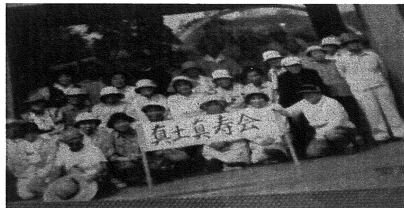
年中行事の大塚山公園の清掃活動での写真です。

親睦、健康保持のため、芸能活動（民謡、カラオケ、コーラス等）、スポーツ活動（ゲートボール、ペタンク、体操等）を推進し、地域との交流を通して福祉の推進に努めています。60歳以上の方、年会費1,200円で会員になれます。ご参加ください。